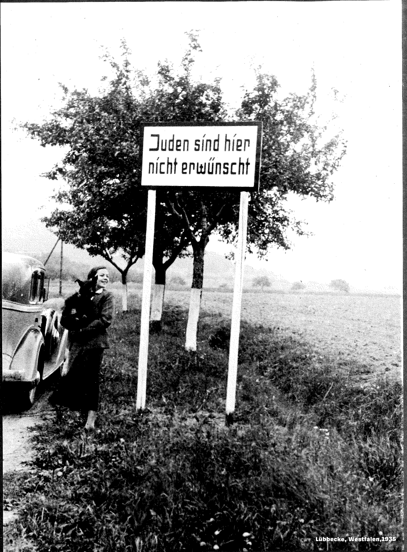
Lübbecke, Westfalen, 1935